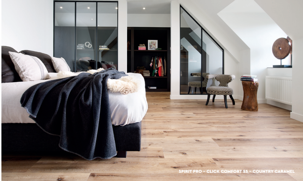
SPIRIT PRO – CLICK COMFORT 55 – COUNTRY CARAMEL